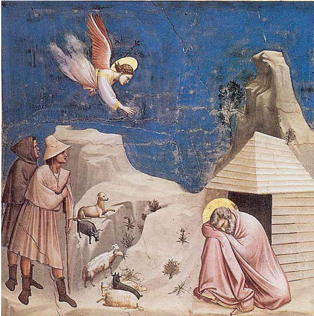
Abb. 01: Joachims Traum - Fresko von Giotto in der Scrovegni Kapelle, Padua (Italien)

a Bereich: Medientheorie und Kunstwissenschaft, Autor, Deutschland, E-Mail: arthur.engelbert@berlin.de, b Freier Künstler (Transmedia), Deutschland, E-Mail: guenther@twosuns.com