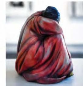
Abb. 02: Detlef Günther, „Joachims Traum_Andenken“; 3D-Druck, Polymergips, (3D_Scan_Wireframe, 3D_Texture, Rundumansicht), Höhe: ca. 12 cm